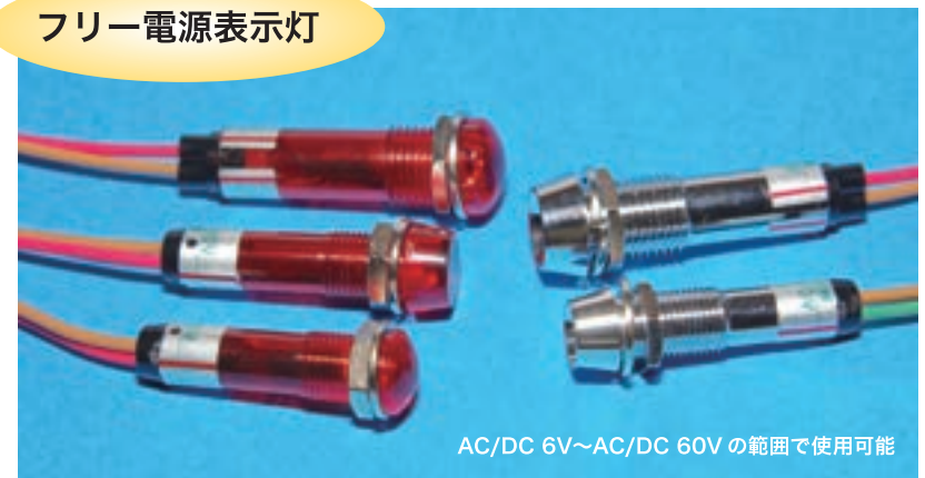
AC/DC 6V~AC/DC 60V の範囲で使用可能